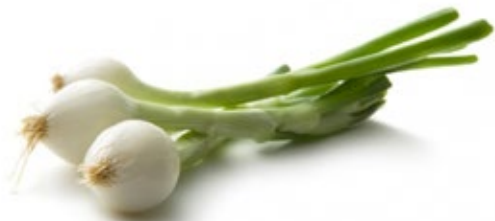
Bosui TotaalVERS, per bos, Art. nr. 20001270