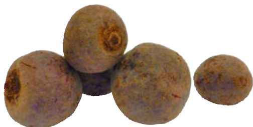
Rode bieten TotaalVERS, 500 gram, Art. nr. 20000121