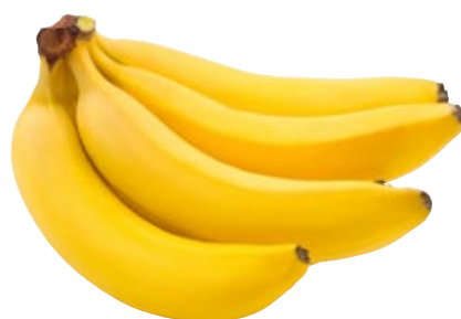
Bananen TotaalVERS, 500 gram, Art. nr. 20001150