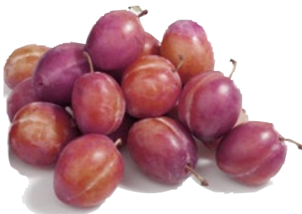
Pruimen TotaalVERS, 500 gram, Art. nr. 20001531