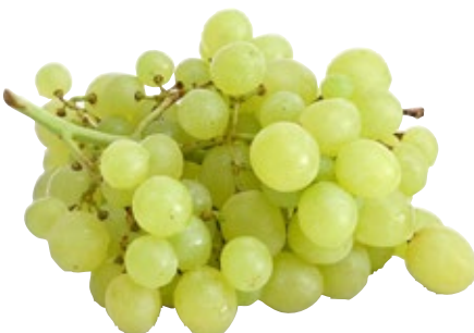
Witte druiven TotaalVERS, 500 gram, pitloos, Art. nr. 20000474