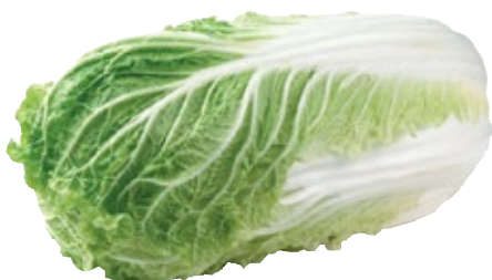
Chinese kool TotaalVERS, 500 gram, Art. nr. 20000147