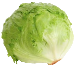
Ijsbergsla TotaalVERS, krop, Art. nr. 20000102