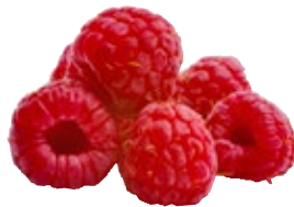
Frambozen TotaalVERS, bak 125 gram, Art. nr. 20001511